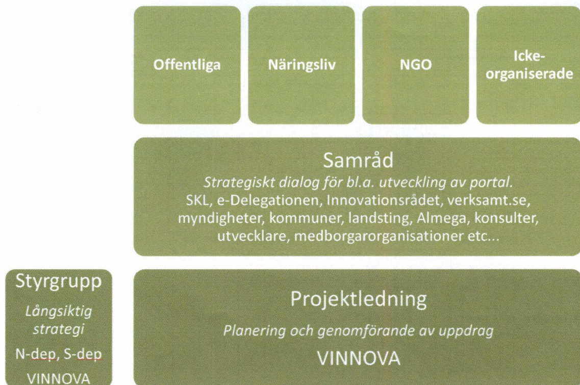
Figur 1. Översiktlig bild över regeringsuppdragets organisatoriska uppbyggnad.