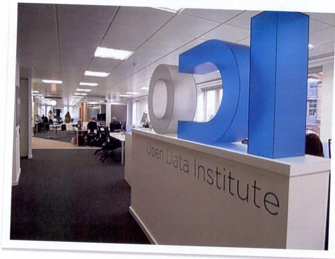
Figur 5. Bild från besök från Open Data Institute, en oberoende aktör som fokuserar på gränsöverskridande vidareutnyttjande av data.

Att delta i konferenser, seminarier och workshops har varit ett centralt sätt att både fånga och sprida erfarenheter. Kontakt har etablerats med centrala aktörer som Open Data Intitute (ODI), Open Knowledge Foundation (OKFN) och European Public Sector Information Platform (ePSIconf).