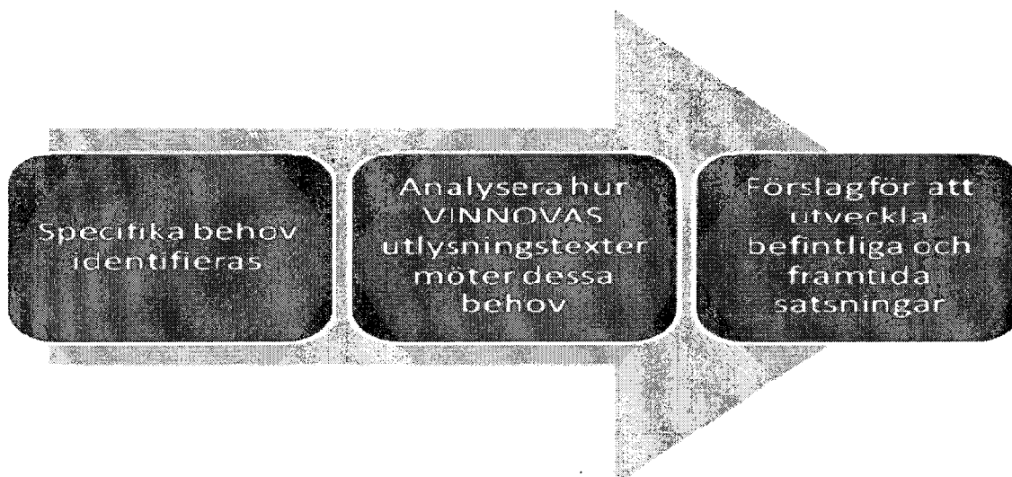
Figur 1 Rapportens upplägg

Först identifieras specifika behov som finns hos företag och organisationer som bedriver tjänstebaserad innovationsverksamhet. Därefter analyseras hur ett urval av VINNOVAs utlysningstexter möter dessa behov. Slutligen redovisas hur VINNOVA avser arbeta för att vidareutveckla och förbättra befintliga och framtida insatser för att bättre möta behoven hos företag och organisationer inom tjänsteekonomin med särskilt fokus på tjänstebaserad innovationsverksamhet. Upplägget presenteras i figur 1 nedan.