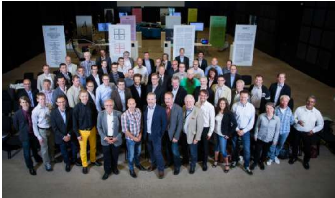
Projektets deltagare samlade vid projektavslutet med tillhörande utställning i juni 2013 i Göteborg

3M KTH - Royal Institute of Technology ACAB - Applied Composites Lamera Arsizio Luleå University of Technology Bendiro Miweco Benteler Engineering Services Müller-BBM Scandinavia Blekinge Institute of Technology Oxeon Borgstena Group Sweden ProfilGruppen Extrusions Bulten Purtech Chalmers University of Technology Ruukki Sverige DYNAmore Nordic SAPA ESSVE Produkter Semcon Caran EWES Stålfjäder SKF Finnveden Metal Structures Stanley Engineered Fastenings FKG - Scandinavian Automotive Supplier Association Swerea-Sicomp Gestamp tesa Glafo - the Glass Research Institute University of Linköping HAVD-Group University of Skövde IAC Group Sweden University West Innovatum Volvo Car Group Kongsberg Automotive